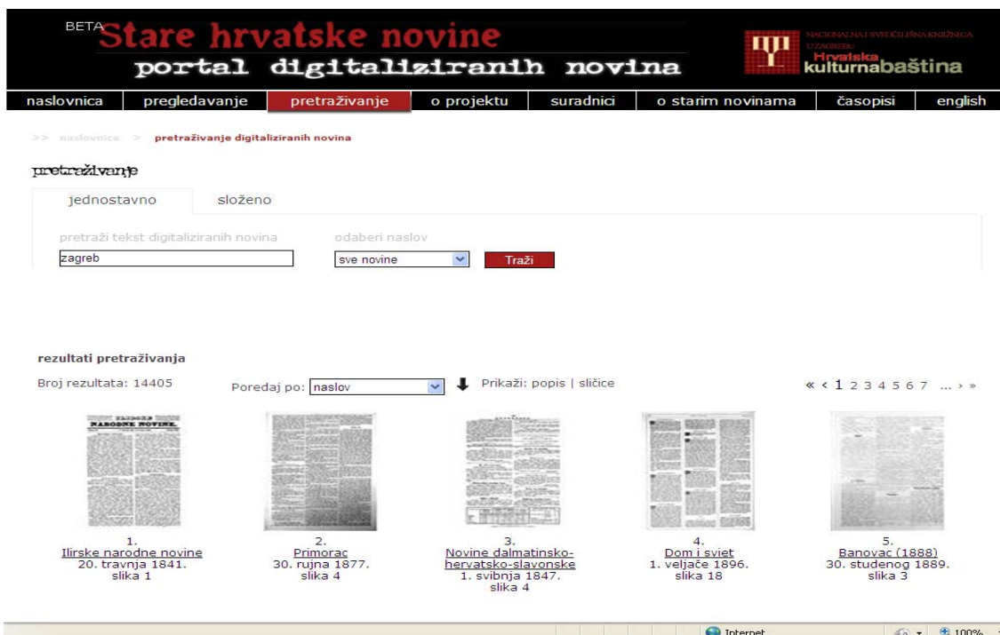
Fig. 5 : Naviguer dans la page du Portail