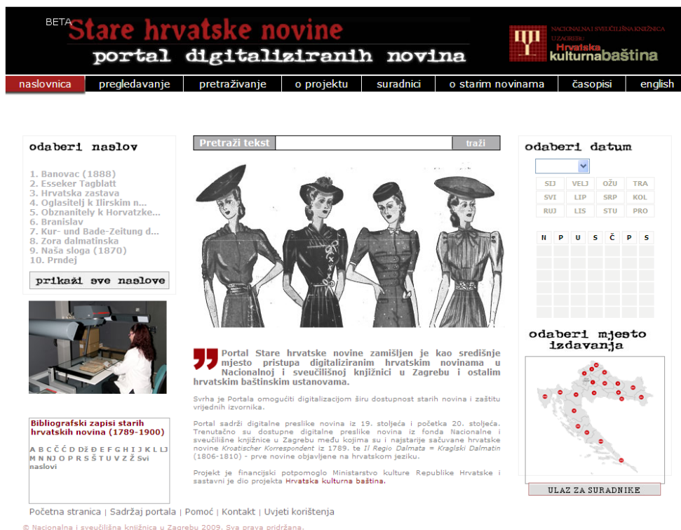
Fig. 1 : Portail des journaux historiques croates

La création du Portail des journaux et revues historiques croates du XIX e siècle (appelé « le Portail » dans la suite de ce texte) est le résultat de l'analyse de cette situation. Un élan supplémentaire est venu des conclusions de la table ronde : l'état des collections de journaux dans les bibliothèques de Croatie, lors de la trente-cinquième assemblée de l'association des bibliothèques de Croatie (Plitvice, September 2006), qui ont souligné le besoin urgent de protéger les journaux du XIX e siècle. 4 Les objectifs fondamentaux de la création du Portail étaient de concevoir une solution intégrée pour empêcher le patrimoine culturel de se détériorer davantage et permettre une conservation à long terme, et d'ouvrir l'accès à d'anciennes collections de valeur de la Bibliothèque et d'autres institutions de sauvegarde du patrimoine au moyen d'un système coopératif d'apport et de gestion des informations. Le nom : le Portail des journaux et revues historiques croates du XIX e siècle est à la fois celui de l'infrastructure et de la superstructure, l'interface visible du système.