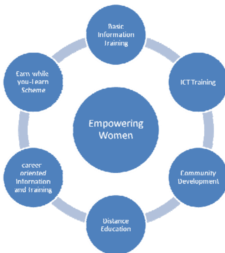
Fig.2 : L'autonomisation des femmes à la bibliothèque de l'Institut

La bibliothèque concrétise son objectif d'autonomiser les femmes de multiples façons (fig.2)