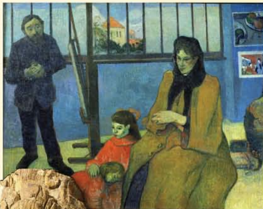
Family Schuffenecker, Gauguin. Reliquary Bust of Charlemagne, 1349. Cathedral Treasury, Aachen.

This rich art image database, available exclusively on WilsonWeb, now offers more than 155,000 works from an impressive roster of distinguished international museum sources.