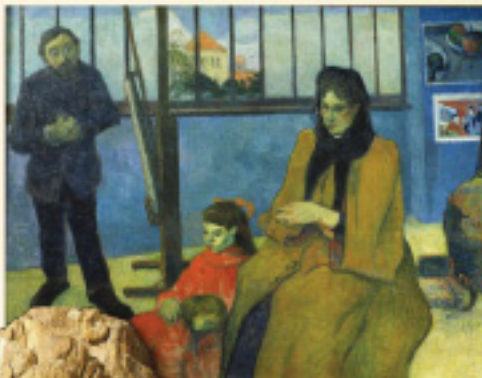
Henry Schuffenecker, Gauguin: Retiquary Room of Chateaugay, 1896. Collette's Library, Inc. All rights reserved. The Art Institute of Chicago, The Art Institute of Chicago, The Art Institute of Chicago.

This rich art image database, available exclusively on WilsonWeb, now offers more than 155,000 works from an impressive roster of distinguished international museum sources.